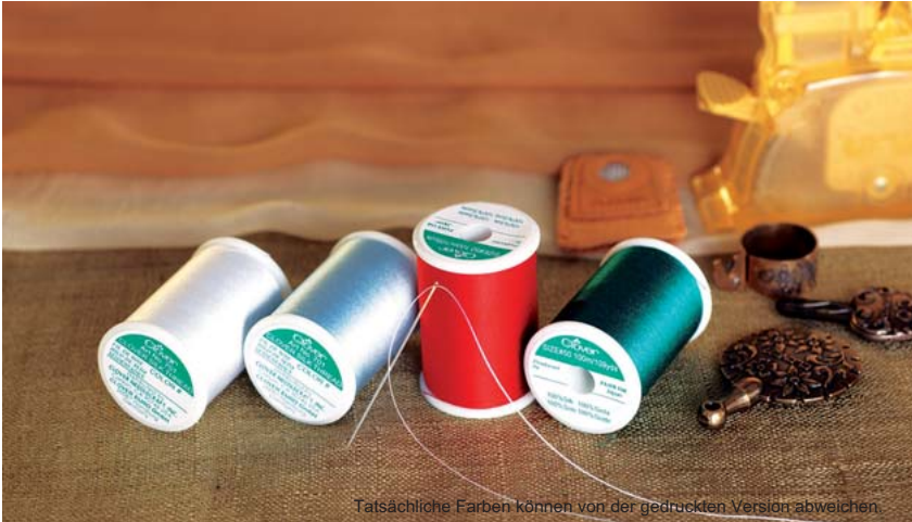
Tatsächliche Farben können von der gedruckten Version abweichen.

Dieser aus 100% Seide bestehende Faden besticht durch natürlich glänzende Schönheit und fühlt sich glatt und weich an. Dank seiner Dehnbarkeit zeichnet er sich durch große Festigkeit und Elastizität aus. Er kann gut für Stoff verwendet werden. Sie können sauber mit dem Faden nähen, wobei jeder Stich präzise durchgeht. Ein Verdrehen oder Kräuseln ist ausgeschlossen. Der Faden eignet sich sehr gut für Appliqué, Nähen, Quilting und Stickerarbeiten.